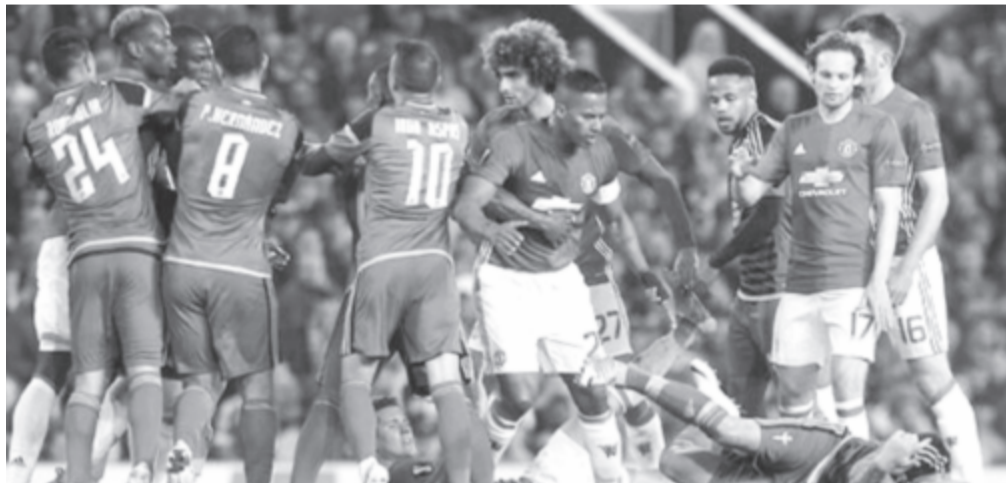
Lökdösődés Manchesterben: egy spanyol szabálytalanság után pofon is elcsattant, és hosszú időbe telt, mire megnyugodtak a kedélyek – a Celta mindazonáltal nem tudott döntetleneél jobb eredményt kiharcolni angliai riválisa otthonában, így kiesett

A Manchester United és az Ajax Amsterdam jutott be csütörtökön a labdarúgó-Európa-liga solnai döntőjébe.