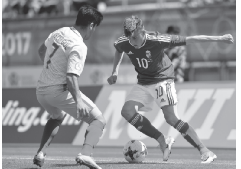
A magyar csapat az egész Eb-n, így a törökök ellen is bizonyította, hogy felveszi a versenyt a legjobb európai válogatottakkal.

A magyar válogatott öngóllal 1-0-ra kikapott a török csapattól pénteken a Horvátországban zajló U17-es labdarúgó-Európa-bajnokság negyeddöntőjében.