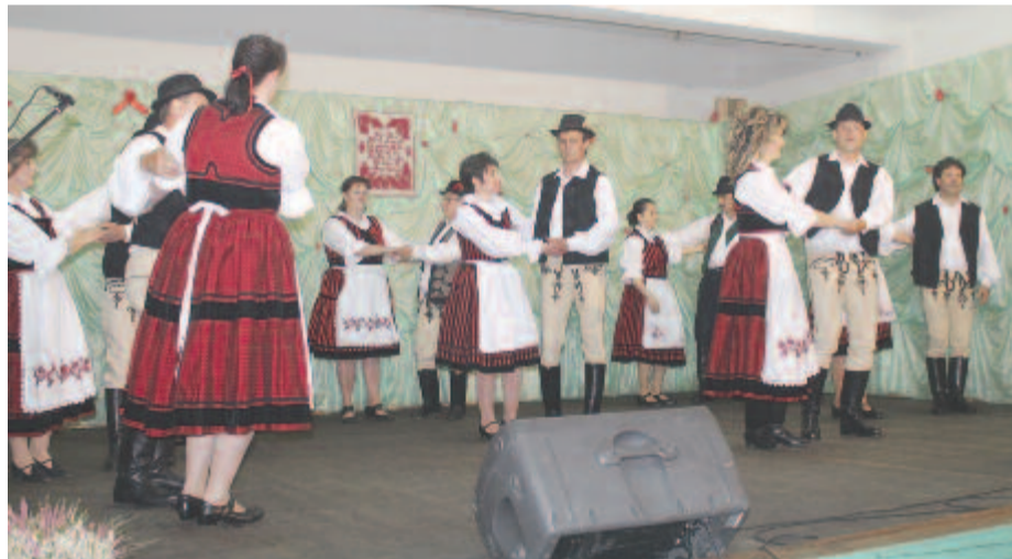
Az Aranykalász tánc együttes

is megszervezhették a néphagyományukat életető tánc csoportok találkozásait, bemutatkozásait és ismerkedését. A helyi református lelkipásztor, Szabó Árpád áldásában arra kérte a találkozó résztvevőit, hogy vidámsítsák fel a közönséget a szomorúság, esős idő ellenére, egy bibliai idézettel