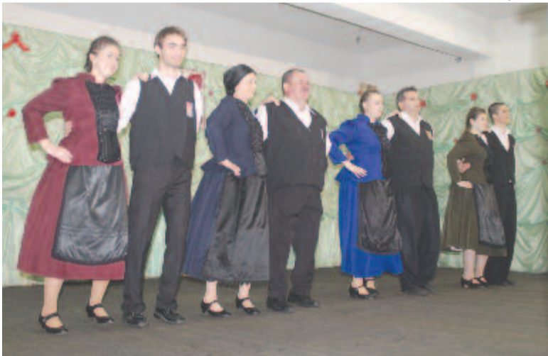
A német csoport