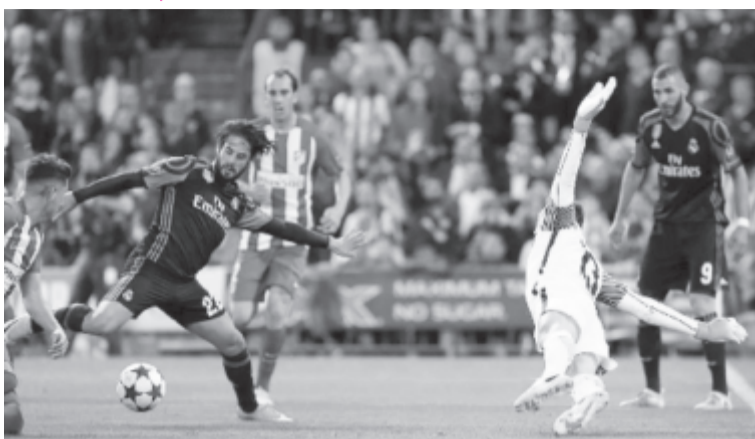
Isco góljával eldőlt a továbbjutás kérdése

A Juventus keddi sikere után szerdán a címvédő Real Madrid jutott a labdarúgó Bajnokok Ligája június 3-án, Cardiffban sorra kerülő fináléjába. Zinedine Zidane együttese az elődöntő visszavágóján ugyan 2-1-re kikapott a városi rivális Atlético Madrid otthonában, de a párharc első felvonásán aratott magabiztos, 3-0-s sikerének köszönhetően nem fenyegette veszély továbbjutását.